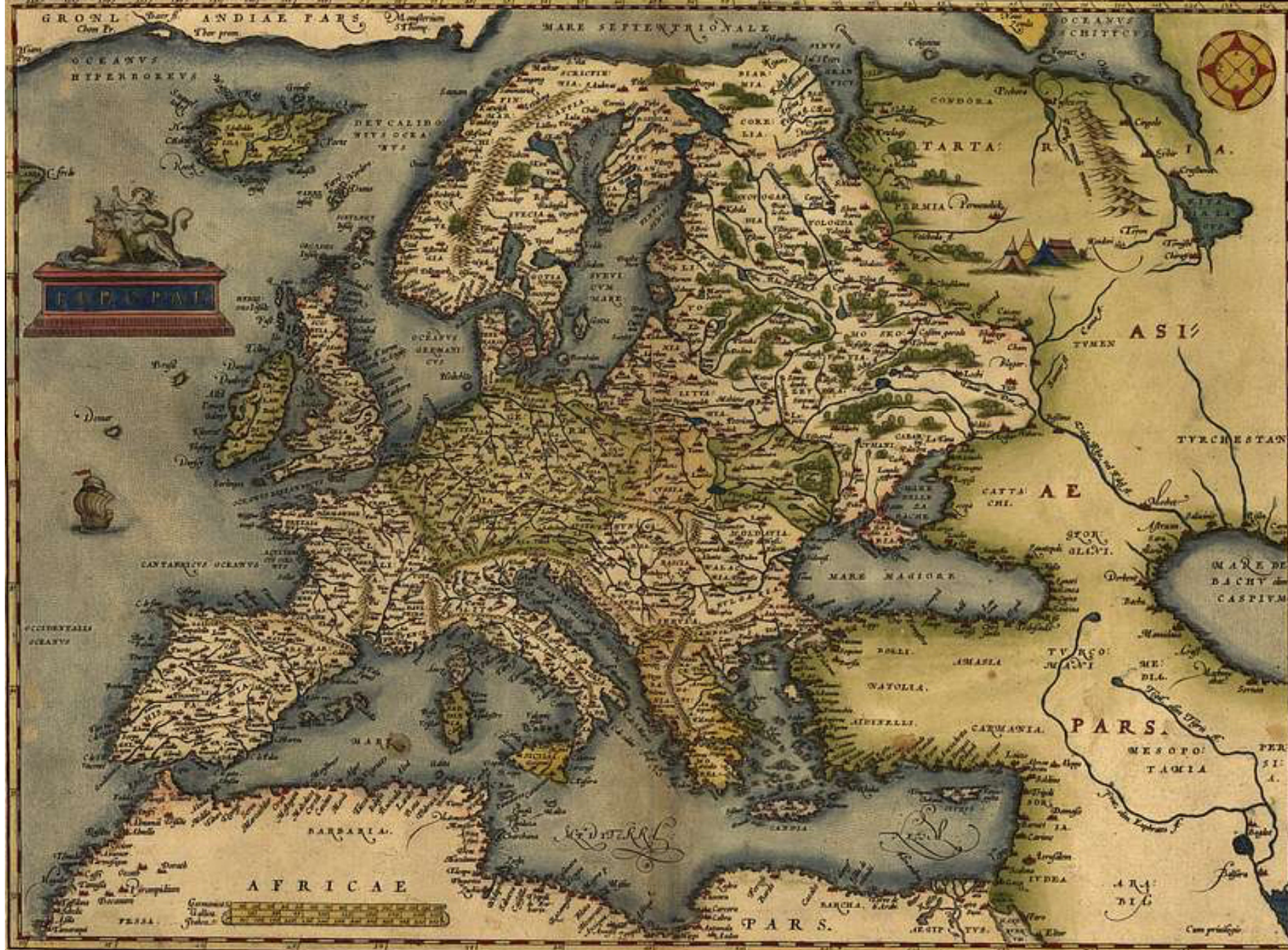
Carte de l'Europe par A. Ortelius, 1571 (public domain vintage map)