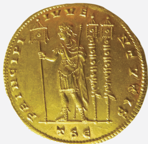
multiple de 4 1/2 solidus