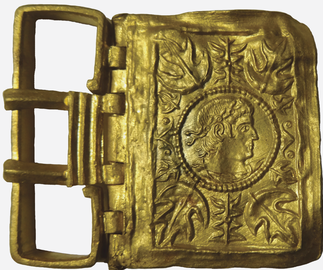
Boucle de ceinturon