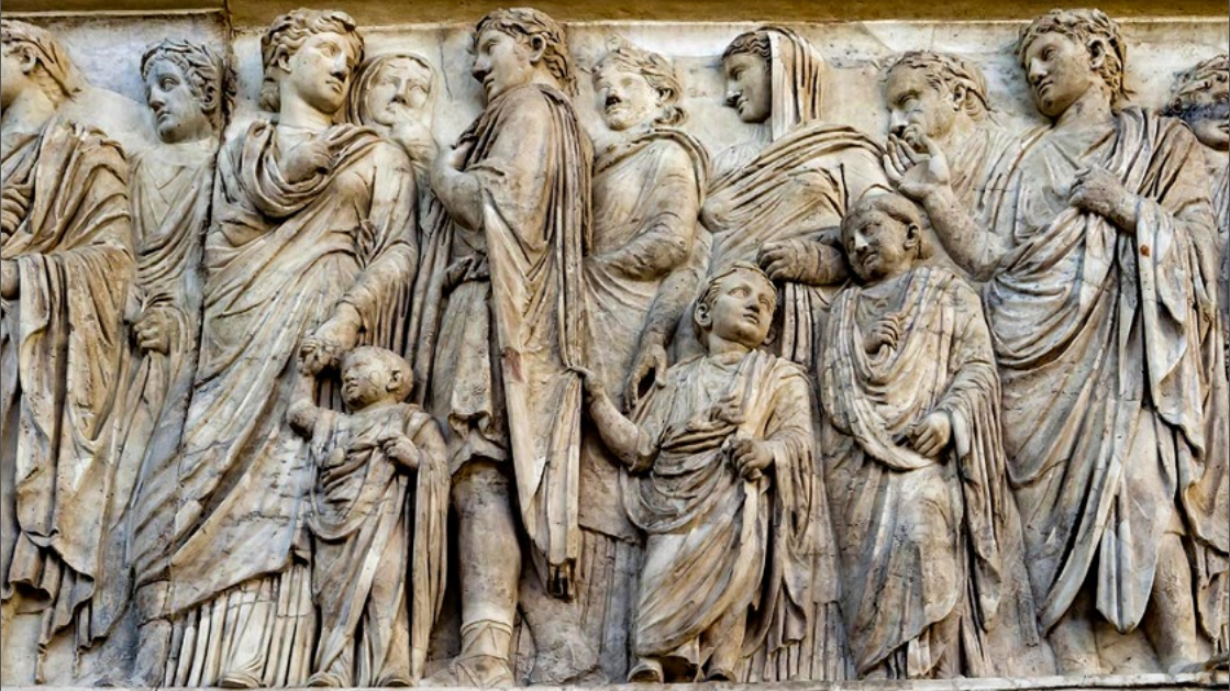
Image : Procession de la frise sud de l'Ara pacis représentant les flamines et la famille d'Auguste (Rome, 13-9 av. n. è.).